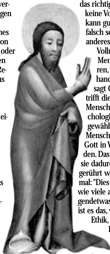
Meister Bertram v. Minden

Jesus sagt die Wahrheit. Er steht für die Wahrheit ein - bis zuletzt - bis zu seinem gewaltsamen Tod am Kreuz. Jesus ist die Wahrheit. Und er sagt den Menschen die Wahrheit über sich selbst und über das Leben. Jesus sagt die Wahrheit, weil er uns Menschen liebt. Er sieht, wie wir uns selbst und anderen Menschen immer wieder im Wege stehen. Er sieht, wie wir am wahren und erfüllten Leben immer wieder vorbeileben. Oft geschieht das, weil wir uneinsichtig sind. Oft ist es Unkenntnis. Da möchte Jesus uns Menschen helfen. Fortsetzung auf S.5