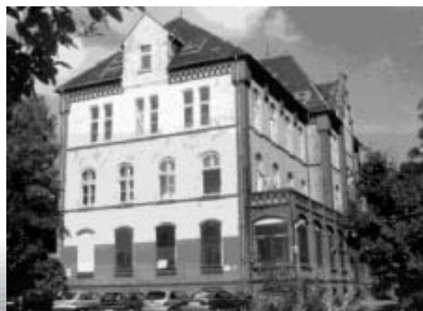
NEUES LAND AHLEM, Wunstorfer Landstr. 5, Hannover