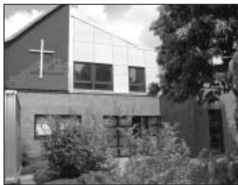
das Gemeindezentrum Hannover-Roderbruch

hung unseres Bauwagens im März. Die Teeniegruppe "Frische Fische" hat hier ihr Zuhause gefunden, nachdem der Bauwagen von Gemeindemitgliedern renoviert und neu eingerichtet worden war. – Besonders hat uns gefreut, dass die Jungchararbeit neu starten konnte, weil sich wieder Mitarbeiter gefunden hatten. Anders als früher und ungewohnt war auch die Einrichtung von