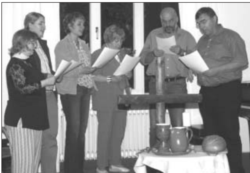
Loben und danken: Abschlussgottesdienst der Sommerbibelschule

Zusammengefasst wurde die Sommerbibelschule 2005 in einem Gottesdienst. Teilnehmer berichteten, wie ihnen während der Tage im Kirchröder Turm Gott begegnet war.