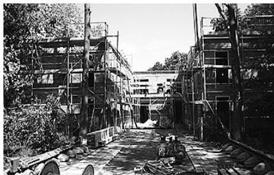
Flüwo: außen / innen

Sonntag, den 23.09.2007 um 10 Uhr feiern wir einen „Festgottesdienst“ im Gemeindezentrum.