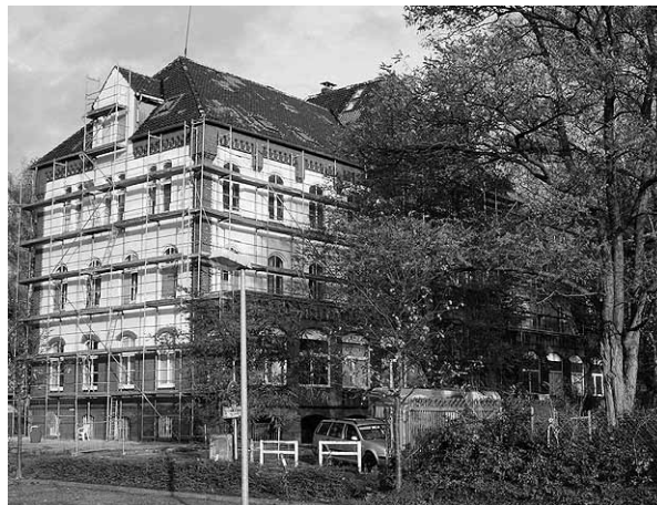
»Beth Hatikva« – das „Haus der Hoffnung“ in Ahlem

„HAUS DER HOFFNUNG“ AHLEM, HANNOVER, Wunstorfer Landstr. 5 (Tram 10 bis Ehrhartstr. oder Bus 700 bis Tegtmeyerallee) - mitten in der Großbaustelle