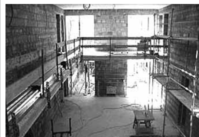
Flüwo: außen / innen

Herzliche Einladung aus der Südstadtgemeinde